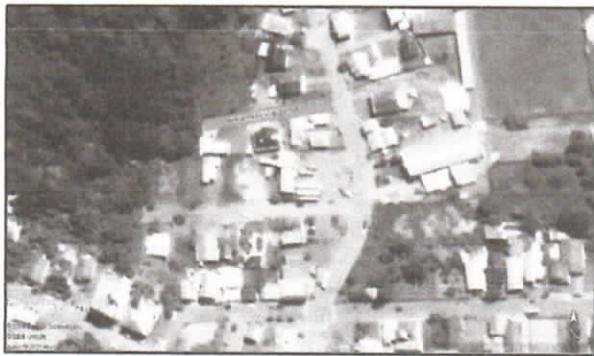
LOCALIZAÇÃO COM IMAGEM

TODAS AS COORDENADAS AQUI DESCRITAS ESTÃO GEORREFERENCIADAS AO SISTEMA GEODÉSICO BRASILEIRO E ENCONTRAM-SE REPRESENTADAS NO SISTEMA UTM, REFERENCIADAS AO MERIDIANO CENTRAL 51 WGR, FUSO 22S, TENDO COMO DATUM O SIRGAS-2000. TODOS OS AZIMUTES E DISTÂNCIAS, ÁREA E PERÍMETRO FORAM CALCULADOS NO PLANO DE PROJEÇÃO UTM.